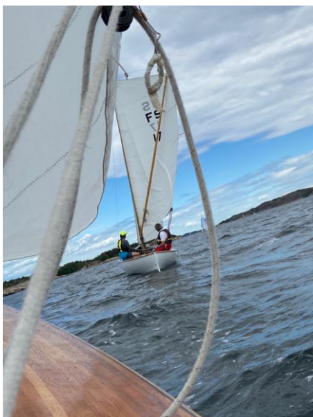
FS 20 på slør (med lånte seil fra FS 17)

Ut over dette har vi ikke registrert eierskifter, nye snekker eller sletting fra registeret.