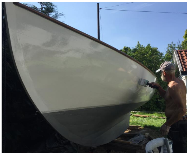
FS 39 får siste strøk på verket